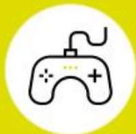
Games und Konsolenspiele